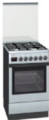
LA COCINA A GAS