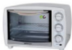
EL HORNO ELÉCTRICO