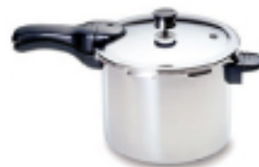
LA OLLA A PRESIÓN