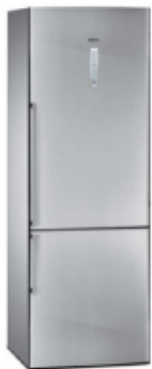
LA NEVERA/ EL FRIGORÍFICO