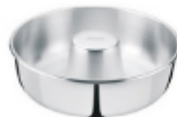
EL MOLDE DE HORNEAR